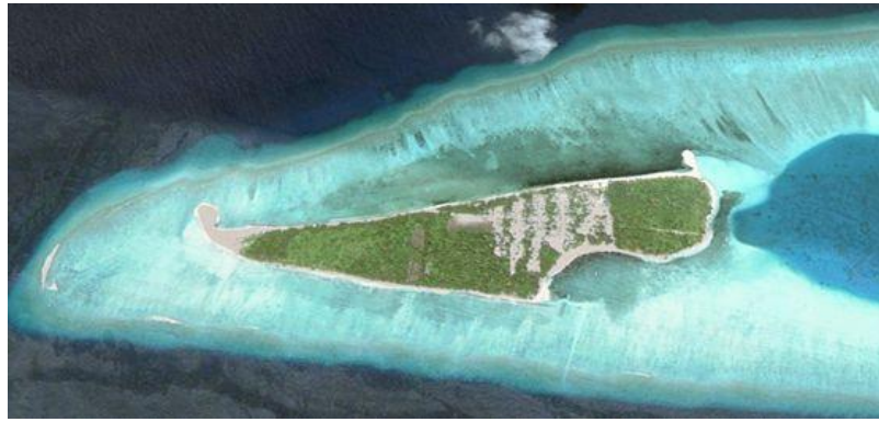
2014 ووتو ارئو ہویا ہر ووتر ارہو لاکو ژی ووتو قیج ہویا ہر ہر لاکو (کاشمیانی)