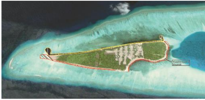
1990 ژی ارئو ہویا ہر ووتر ارہو لاکو ژی ووتو قیج ہویا ہر ہر لاکو (کاشمیانی)